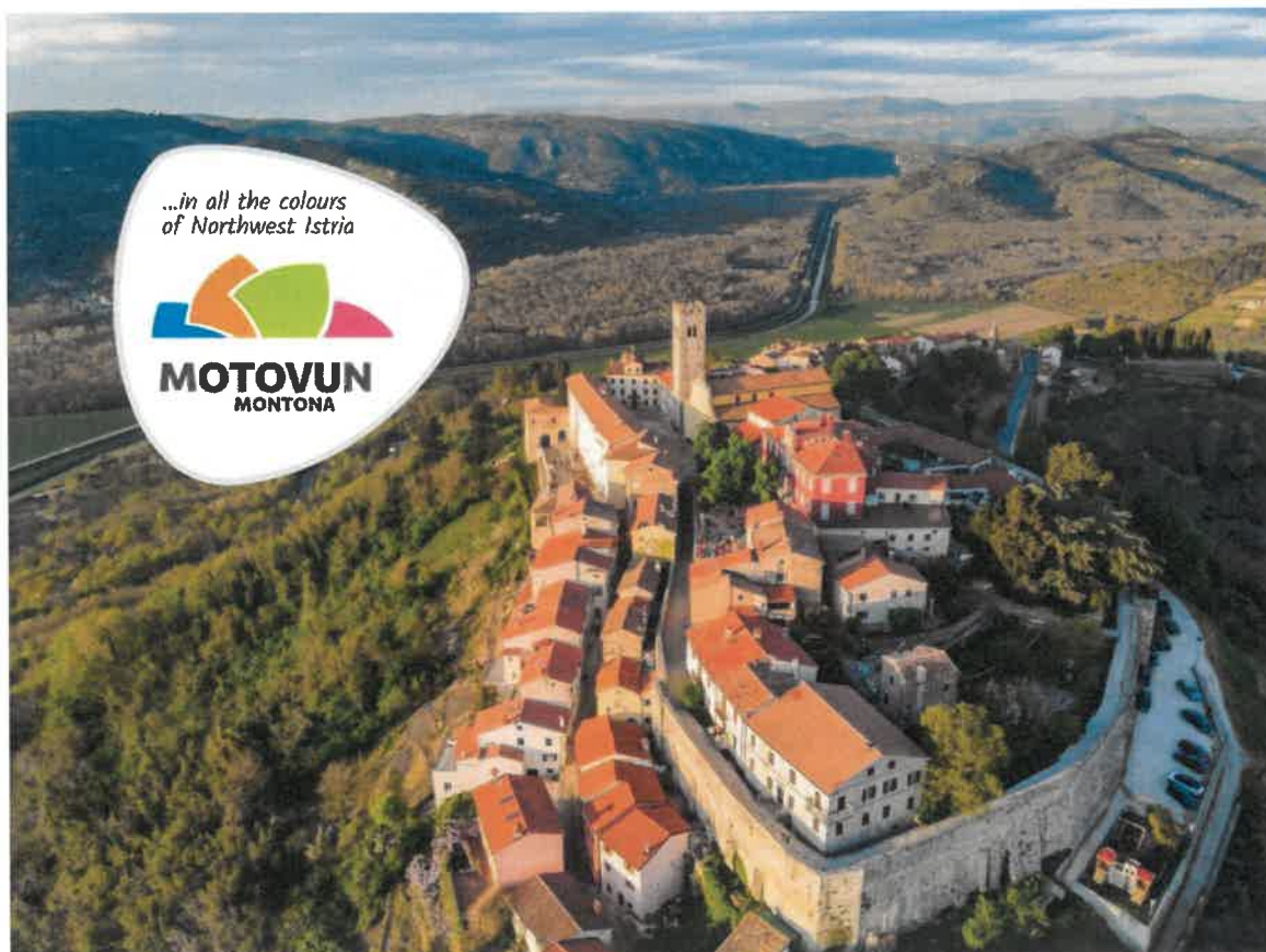
Motovun – turistički dragulj unutrašnjosti Istre