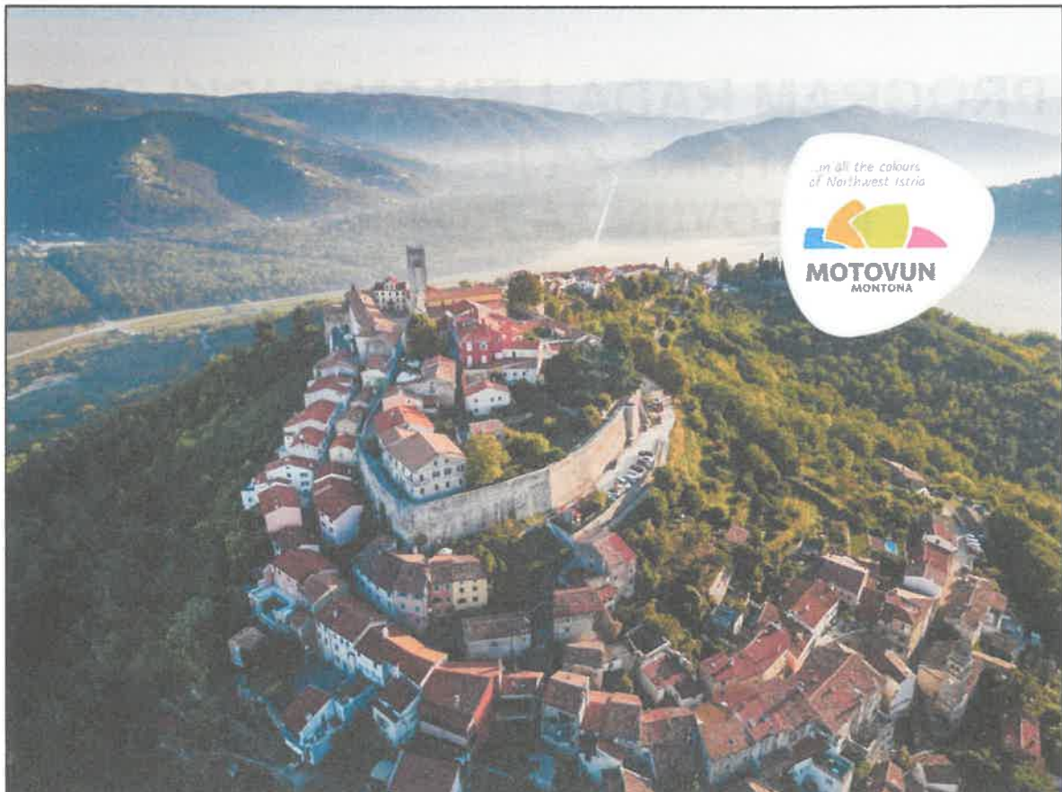
Motovun – kulturni i turistički dragulj unutrašnjosti Istre