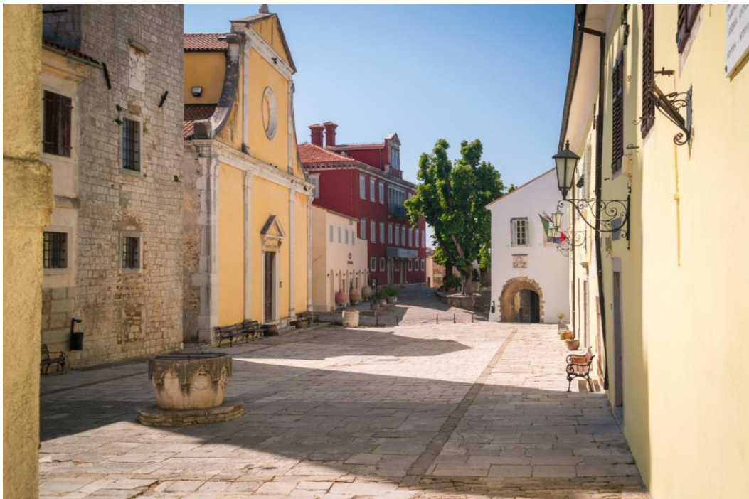
Motovun – turistički dragulj unutrašnjosti Istre